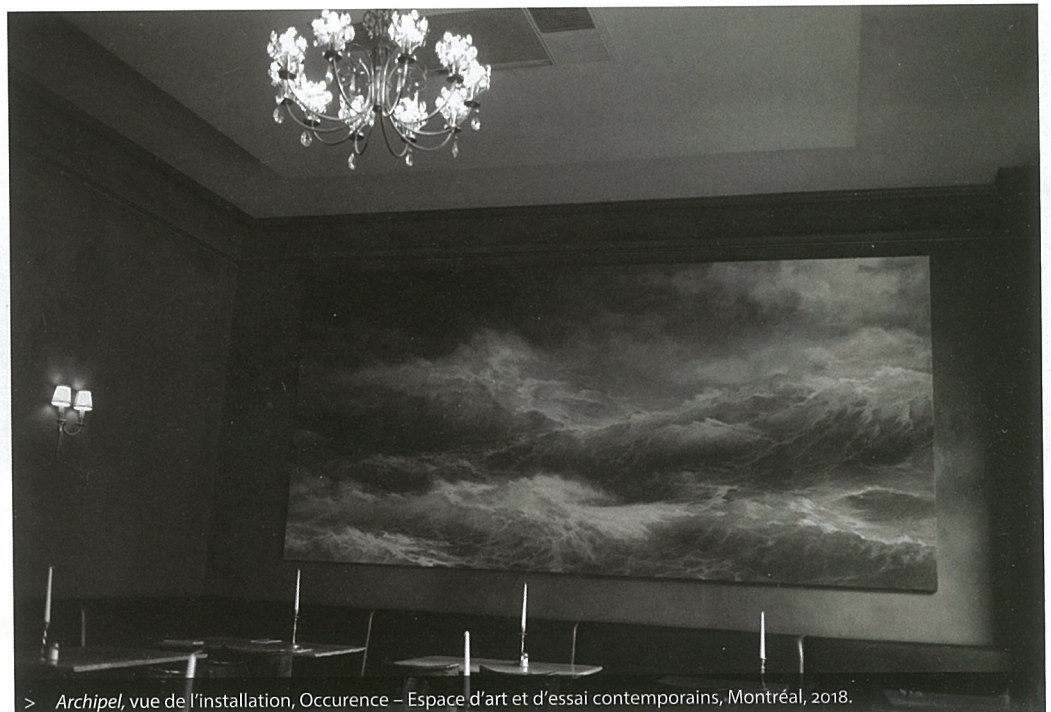
> Archipel , vue de l'installation, Occurrence – Espace d'art et d'essai contemporains, Montréal, 2018.

Sylvain Campeau collabore à de nombreuses revues canadiennes et européennes. Il est aussi l'auteur des essais Chambres obscures : photographie et installation , Chantiers de l'image et Imago Lexis , de même que de sept recueils de poésie dont le tout récent Dire encore après... En tant que commissaire, il a à son actif une trentaine d'expositions.